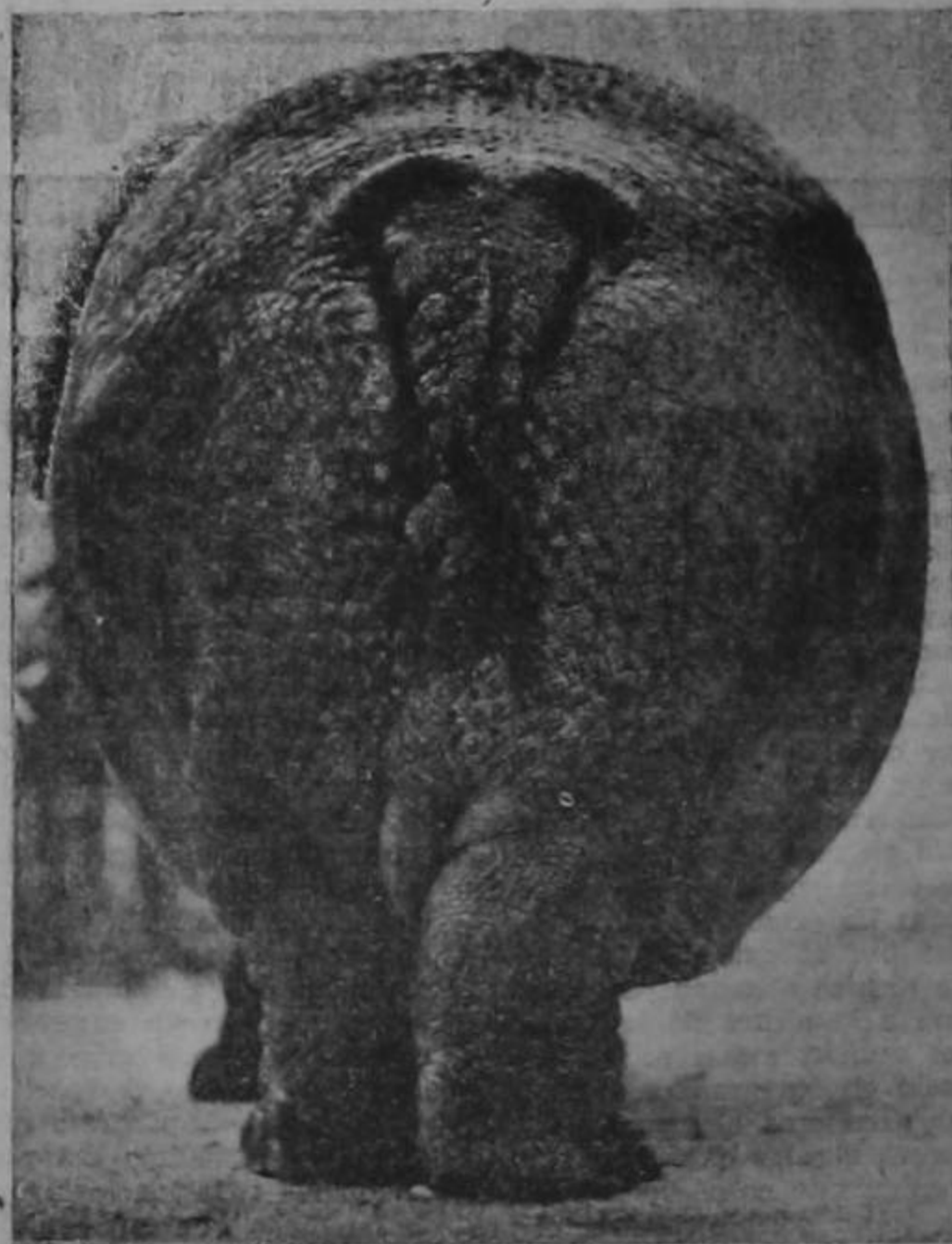
Visto por detrás